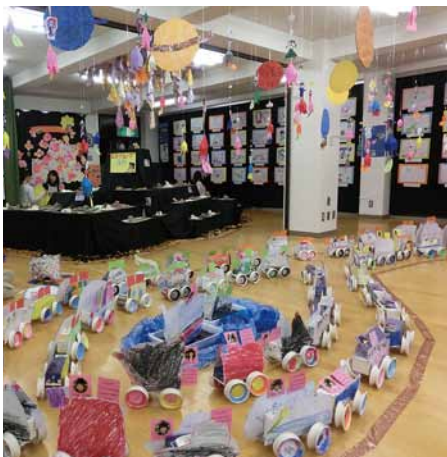
2012年度あさひ幼稚園作品展