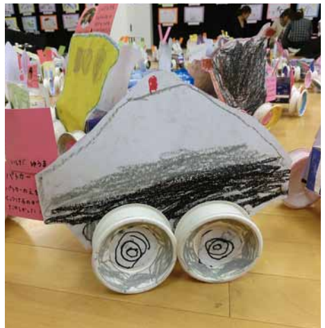
パトカー / 4歳児 (あさひ幼稚園)