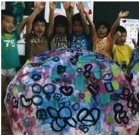
紫陽花 / 4歳児 (小屋浦保育所)