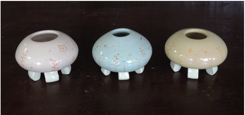
海月花器 中西 希文【専攻科】 200×600×120mm ろくろ