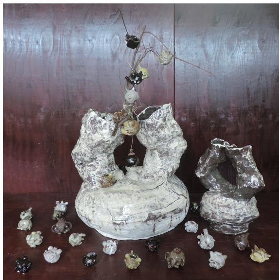
土鈴の木 國川 晴香 650×650×800mm 玉つくり