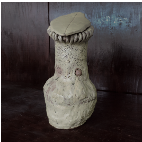
ウツボカズラ① 田村 いづみ 490×160×400mm 手びねり