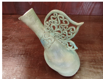
雫 陳 勵寧 280×150×280mm 手びねり