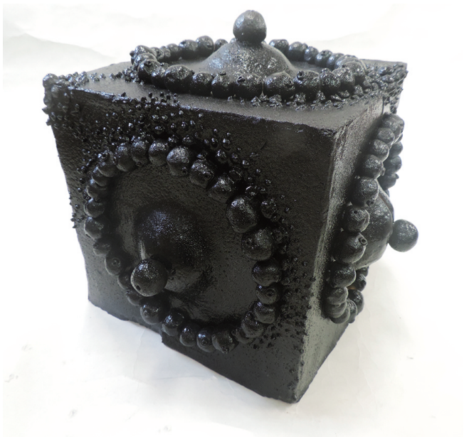
母性—角— 中務 志保 25×25×25mm 手びねり