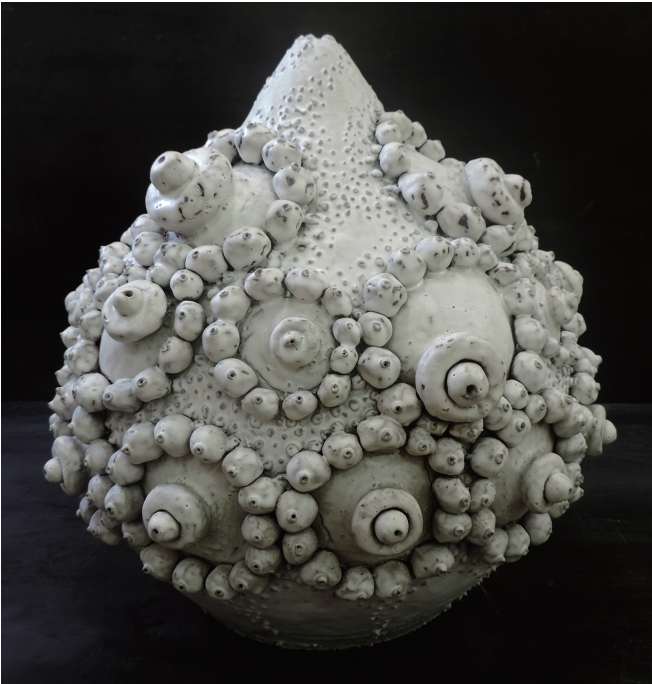
母性—しずく— 中務 志保 450×450×500mm 手びねり