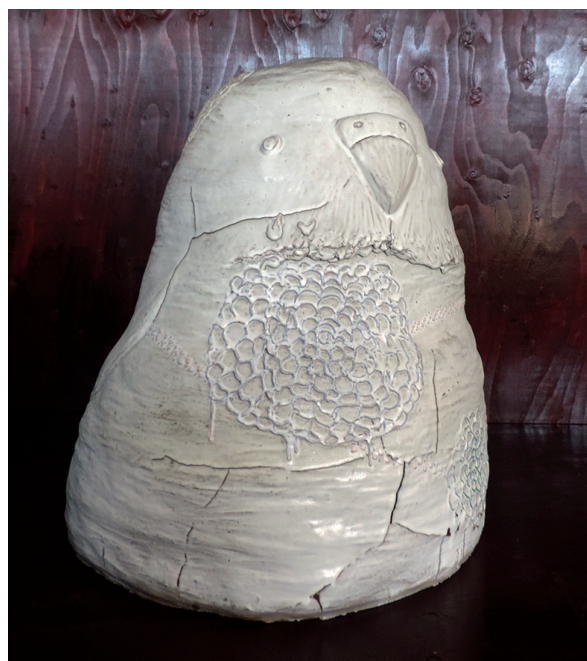
明日を見つめるトリ 石原 美希 600×900×800mm 手びねり