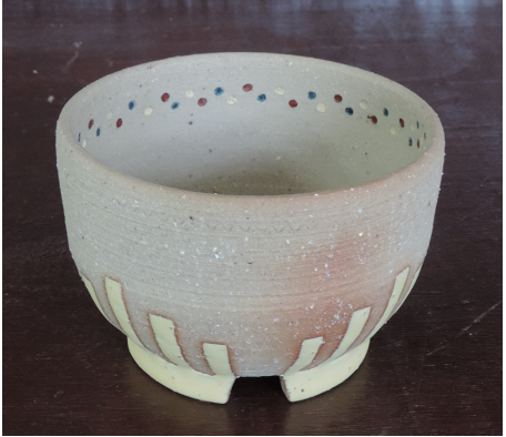
マイフラワーポット 中西 希文【専攻科】 130×130×90mm ろくろ