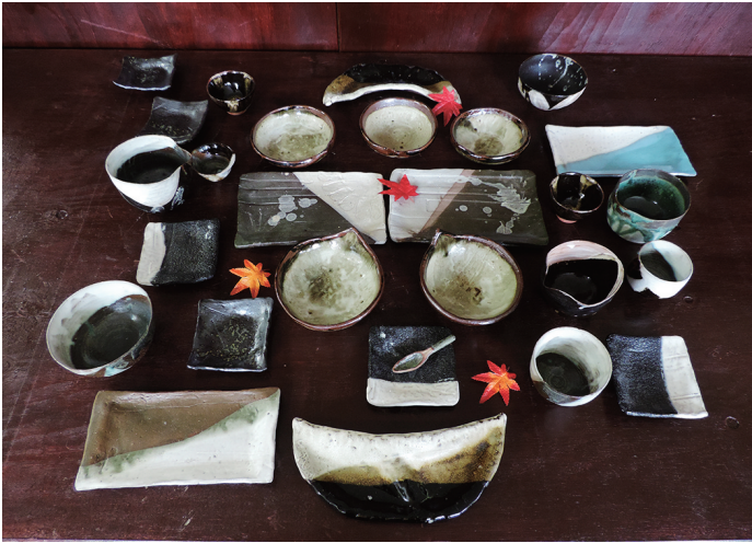
夕食の集い 時友 明花 1000×1000×100mm ろくろ タタラ板