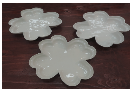
幸運草〜コウウンソウ〜 陳 勵寧 440×490×35mm 鋳込み