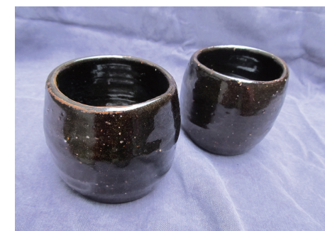
夫婦ゆのみ 石原 美希 90×70×90mm ろくろ