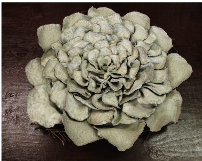
ひかり 陳 勵寧 540×540×130mm 手びねり