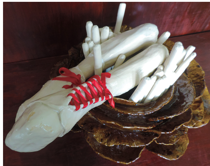
LOVER 佐藤 美樹 700×600×300mm 手びねり