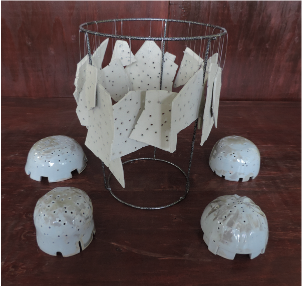
星 井川 奈緒【専攻科】 450×850×285mm 板づくり