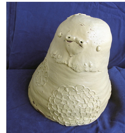
孵化したトリ 石原 美希 300×500×400mm 手びねり