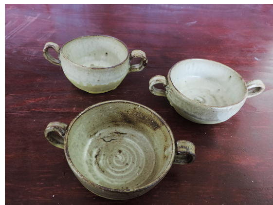
スープカップ 國川 晴香 300×400×100mm ろくろ