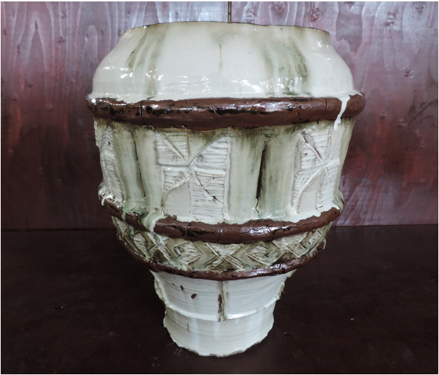
風の音 時友 明花 300×300×1000mm 手びねり