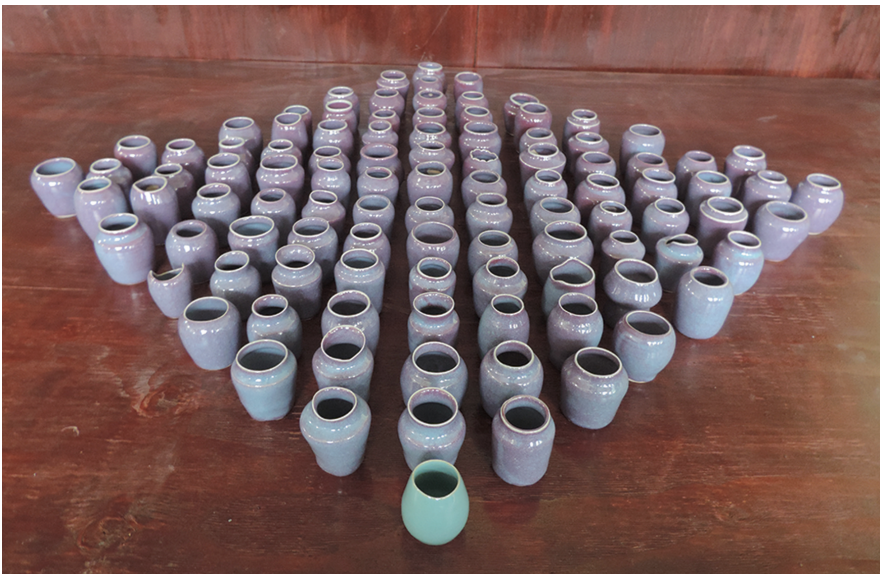
均窯釉 還元焼成 井川 奈緒【専攻科】 360×1000×50mm ろくろ