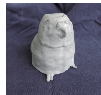
小鳥 石原 美希 100×200×100mm 手びねり