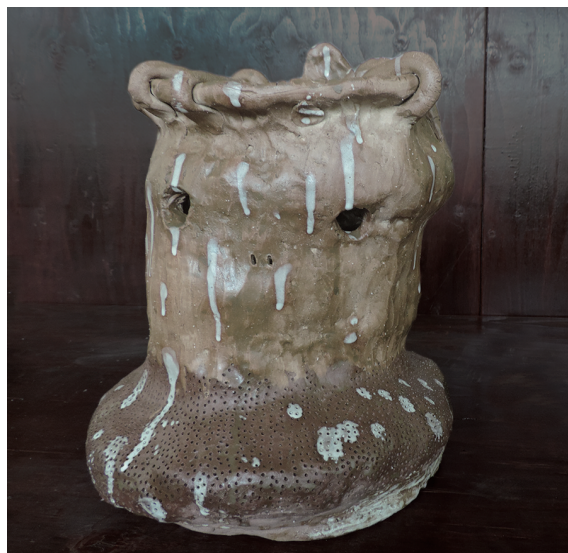
ウツボカズラ② 田村 いづみ 150×102×100mm 手びねり