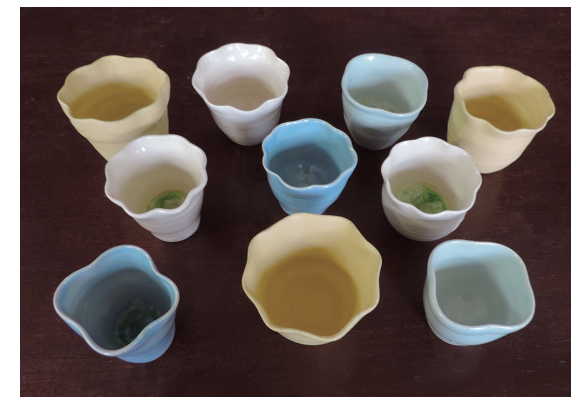
花カップたち 佐藤 美樹 600×900×600mm ろくろ