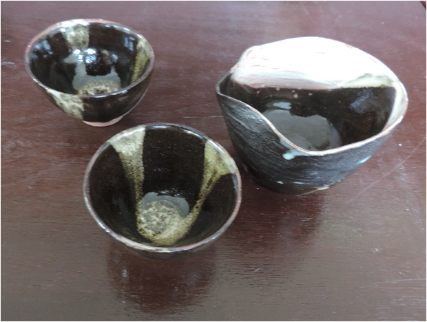
夜の楽しみ 時友 明花 300×600×100mm ろくろ タタラ板