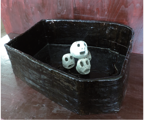
棺 皆実 洋孝 300×900×300mm 手びねり